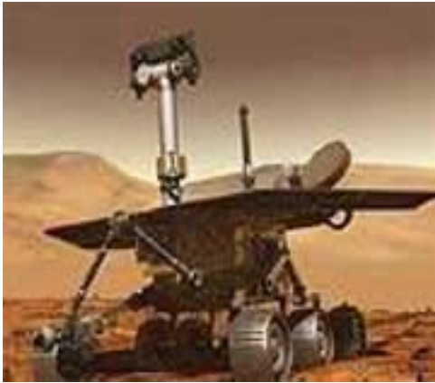
Figura 01 – Jipe-robô Spirit